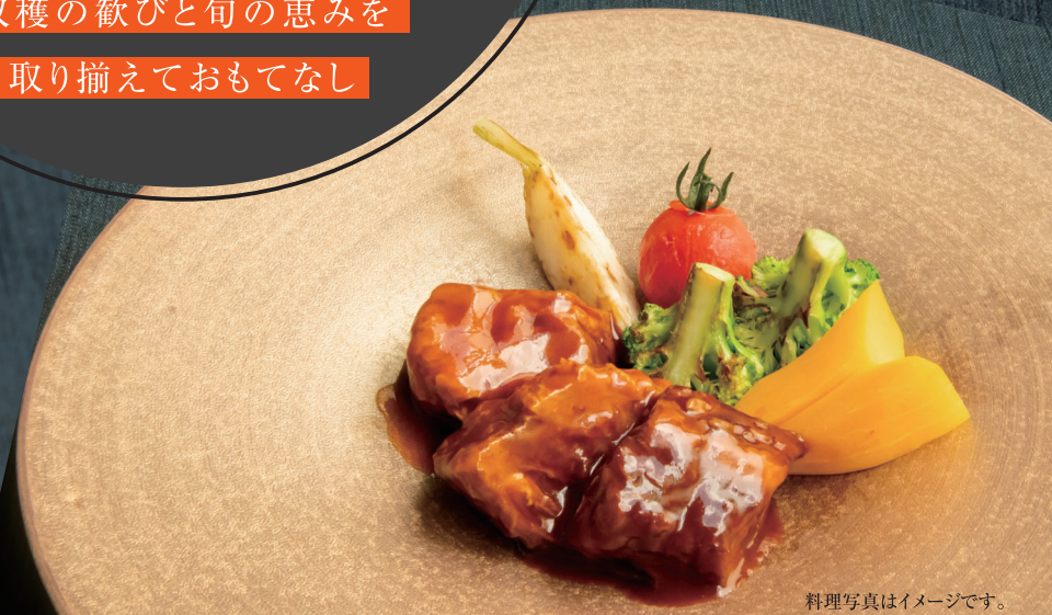
料理写真はイメージです。