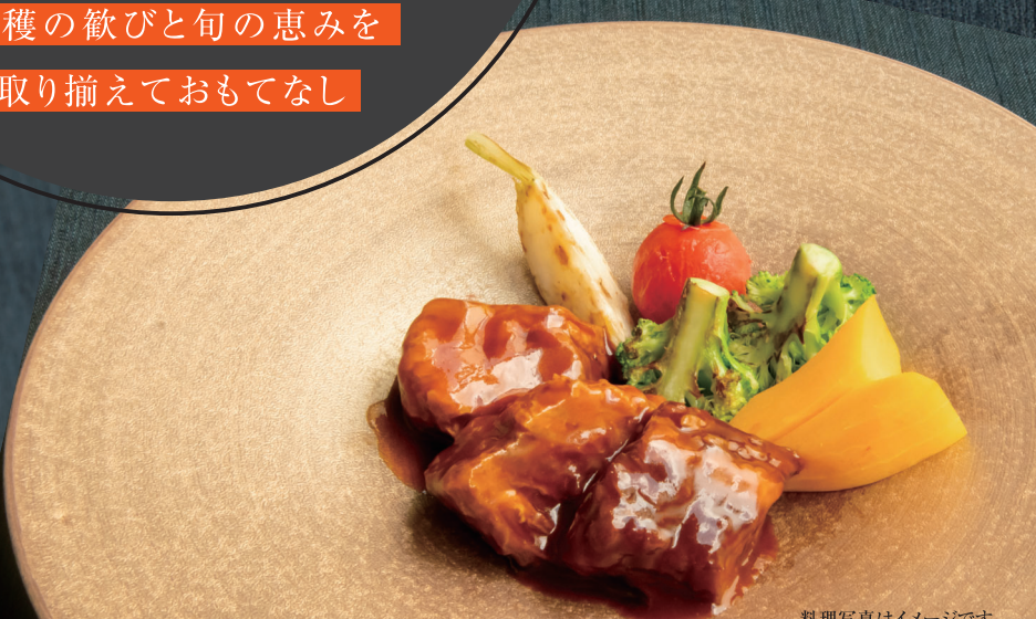
料理写真はイメージです。